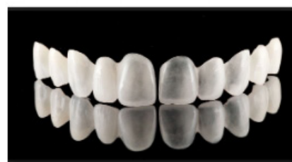
Facettes provisoires transparentes modifiables jusqu'au choix final.