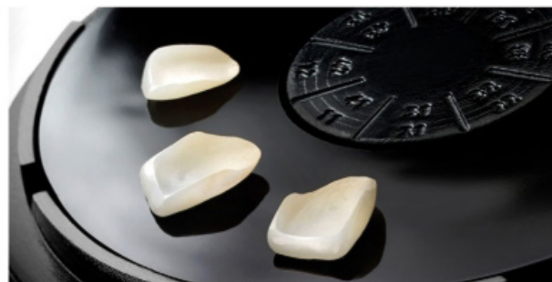
Facettes définitives en céramique.

À NOTER : une préparation des dents (hauteur et dimension) est parfois nécessaire pour accueillir au mieux les futures facettes. En fonction du modèle retenu, une préparation pelliculaire a minima sur la face externe des dents sera effectuée, en retirant une infime couche d'émail (de 0,2 à 0,5 mm). L'intervention est indolore.