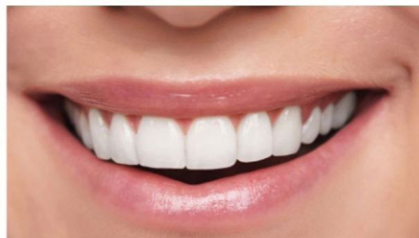
Résultat final après pose des facettes céramiques.