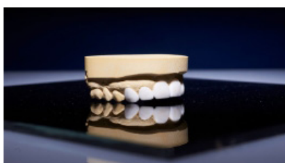
Mock-up : maquette en cire élaborée à partir du moulage des dents.